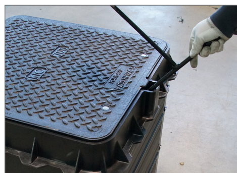
uniwersalny klucz US-3 ROM-Box SD