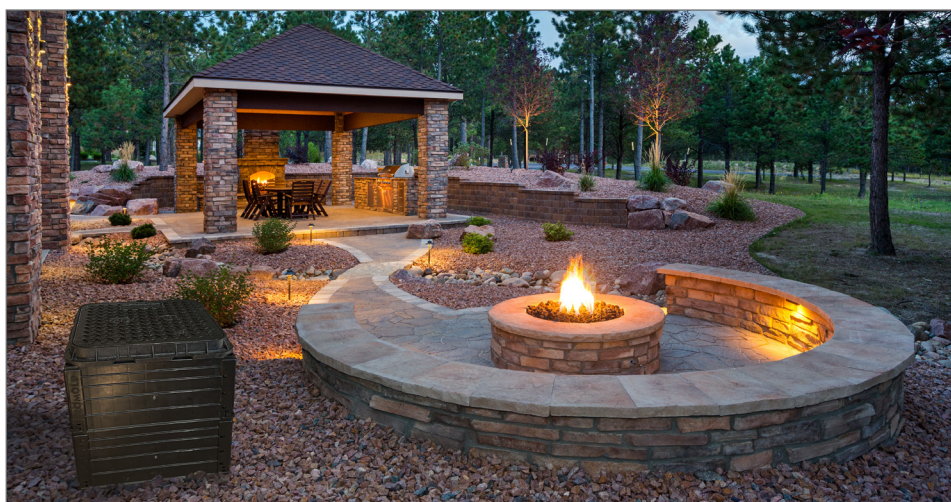
dla różnych zastosowań