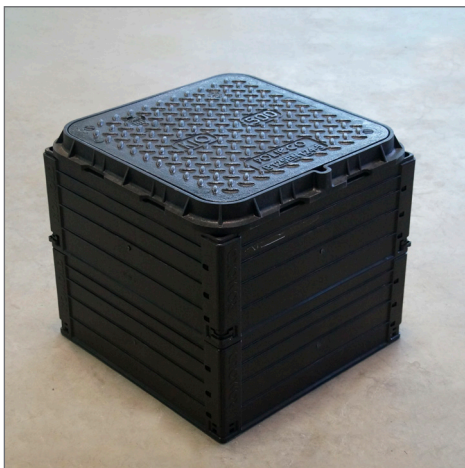
ROM-Box 405x405 kompletny z włazem