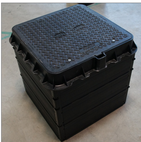
ROM-Box 60/60 kompletny z włazem