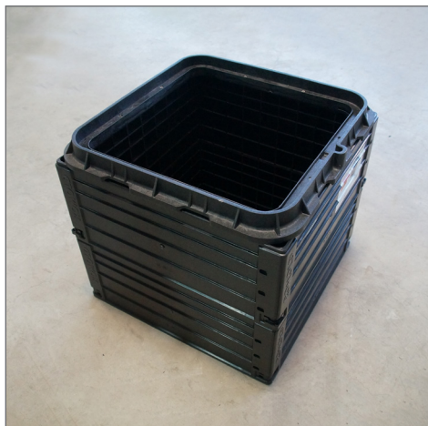
ROM-Box 40/40 z przykręconą ramą

Skrzynka ROM-Box wymiar w świetle 405x405 mm jest wykonana w całości z wtryskowo wykonanych profili z gładką ścianą zewnętrzną. Pokrywa jest przymocowana na stałe do zasobnika ROM-Box śrubami ze stali nierdzewnej, przez to nie ma możliwości płynnej regulacji. Zabezpieczenie pokrywy stanowią 4 śruby z tworzywa. Wymiary zewnętrzne: 485 x 485 mm. Wysokość całkowita 440 mm.