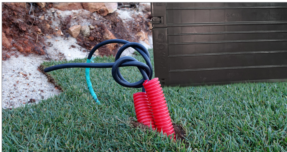
ROM-Box GALA: łatwy w montażu