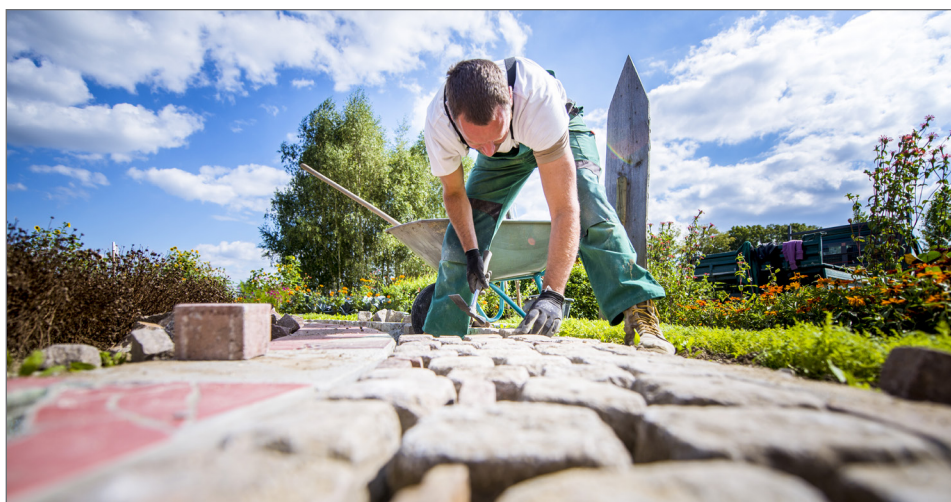
lekkie i przyjazne w montażu nawet dla 1 osoby