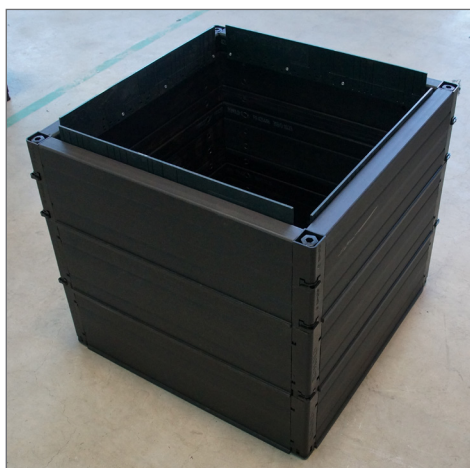
ROM-Box 60/60 z wewnętrznymi ogranicznikami

Zakres zastosowania ROM-Box z pokrywą kompozytową ograniczony do klasy B 125 wg EN 124! Pokrywa z tworzywa sztucznego z podwójną blokadą ze stali nierdzewnej, wysokość pokrywy = ok. 100 mm. Zasobnik ROM-Box wymiar w świetle 600x600 mm wykonany z elementów wytłaczanych, tj. gładkiej ściany zewnętrznej i wewnętrznej. Listwa wewnętrzna jest przymocowana do górnego profilu służy jako zabezpieczenie przed przesunięciem ramy pokrywy. Zasobnik jest dostarczany jako skrzynka i pokrywa, bez stałego montażu. Wymiary zewnętrzne: 680 x 680 mm. Skrzynka ROM-Box GALA 60 60 dostępna jest w 2 wysokościach: wysokość całkowita 700 - 750 mm lub 800 - 850 mm.