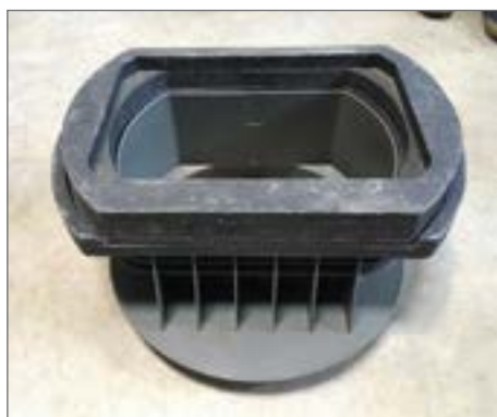
PDRD 50.30/02 VS + PARD 50.30/06 VS dla wpustu ROMOLD typ GRIT