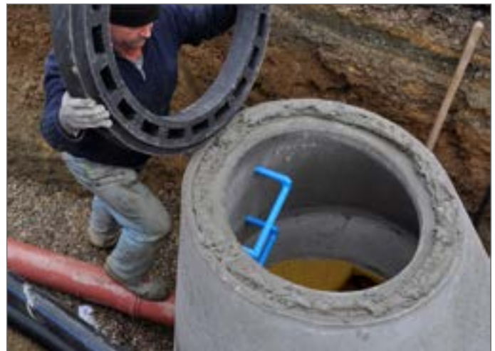
wybrać i założyć odpowiedni pierścień wyrównawczy (można wybrać także kombinację elementów)