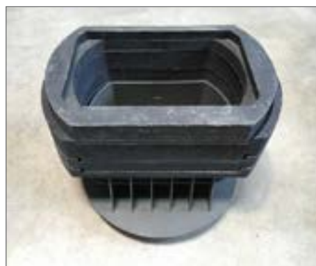
PDRD 50.30/02 VS + 04 VS + 06 VS + PARD 50.30/06 VS dla wpustu ROMOLD typ GRIT