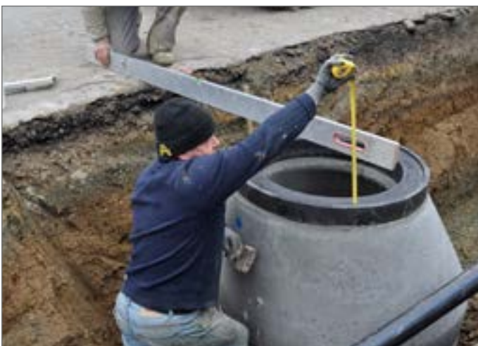
ustawianie i wypoziomowanie pierścienia ewentualnie nałożyć inne pierścienie