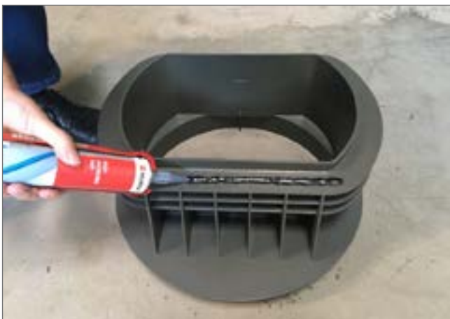
nałożenie kleju montażowego na wpust GRIT 40.50.30/13

Jeśli istnieje potrzeba trwałego połączenia między elementami, można ją wykonać stosując czarny PU-klej konstrukcyjny (np.: firmy Würth, nr kat. 0890100730 lub nr kat. 08901003) celem wykonania silnego połączenia.