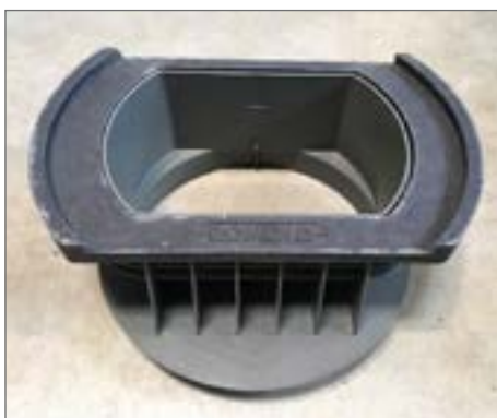
PDRD 50.30/02 VS dla wpustu ROMOLD typ GRIT