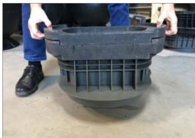
niewielka wytrzymałość na rozciąganie między elementami

Należy nanieść klej na całym obwodzie za pomocą pistoletu do kartridża. Następnie ułożyć górny element i wyrównać. Docisnąć klejone płaszczyny obciążeniem (masy ciała).