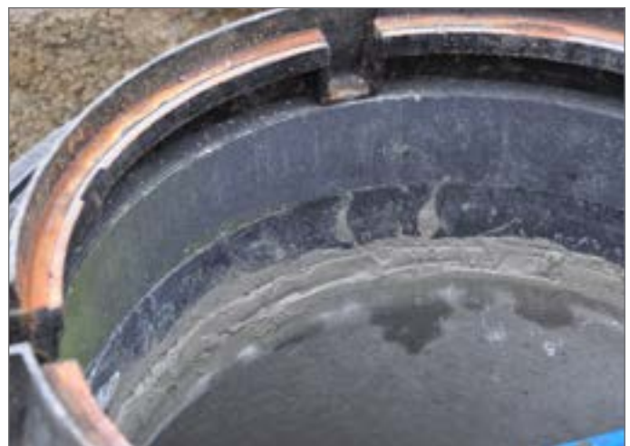
dla szczelnego połączenia (sklejenia) użyć np.: PU-klej konstrukcyjny firma Würth, numer kat. 0890100730 lub 08901003 i nałożyć włącz.