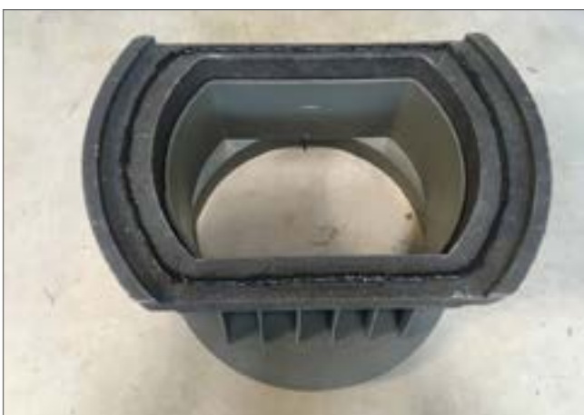
klej nakładany obwodowo na PDRD 50. 30/xx VS