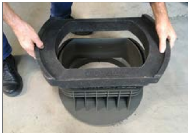
nałożenie i dociśnięcie pierścienia PDRD 50.30/xx VS na klej