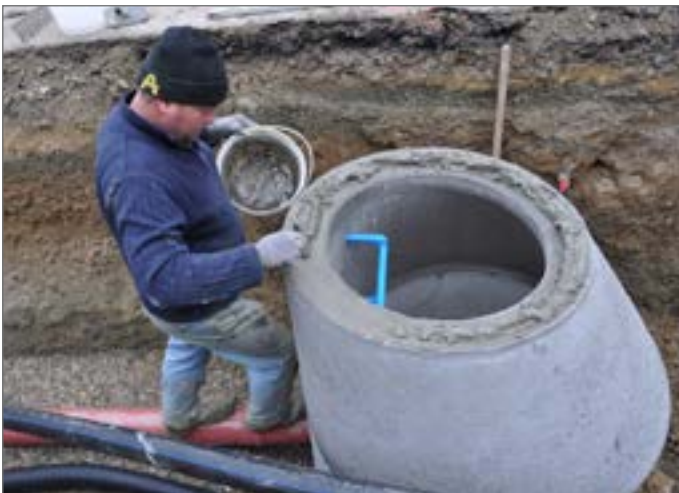
szybkie naniesienie zaprawy cementowej (wiążącej) (przykładowo PCI Polyfix Plus / lub PCI Polyfix Plus L)